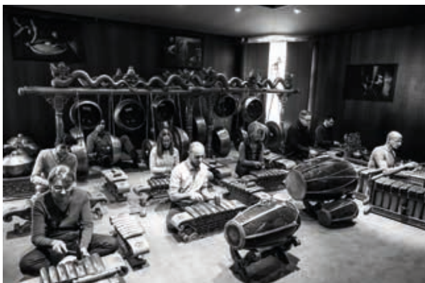
Gamelan de Java

Claude Debussy a assisté à plusieurs reprises au spectacle de danses du Village javanais de l'Exposition universelle de 1889. De nombreuses études décrivent les influences que l'écoute du gamelan a eues sur l'œuvre du jeune compositeur. Le placement et la couleur de timbres soutenant pentatonisme et hétérophonie sont les deux composantes les plus fréquemment retenues des transformations qui voient le jour, à partir de ce moment, dans ses compositions.